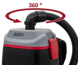
Поворотное соединение на 360°, безграничная маневренность.