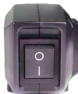
Удобная кнопка включения.