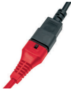
Встроенная защита кабеля.