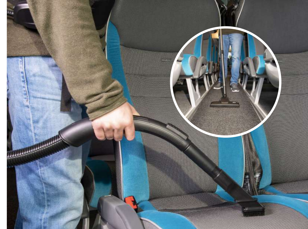
Предмет номер. Соединенное производство