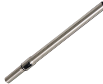
Трубка телескопическая нержавеющая 0,6–1,0м. Предмет номер. 111,133