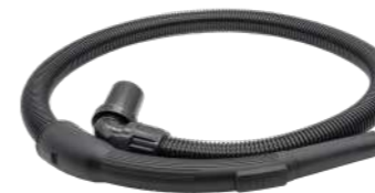
Всасывающий шланг 1,3 м. Предмет номер. 119,124