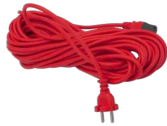
Шнур питания, 15 м с возможностью подключения.