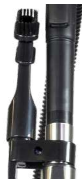
Удобное хранение аксессуаров.