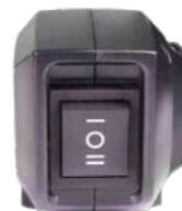
ECOMode с аккумуляторной версией.