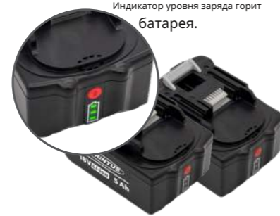
Индикатор уровня заряда горит батарея.