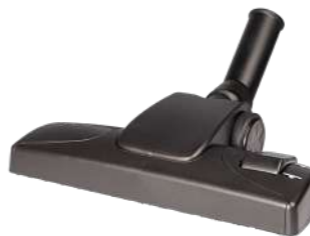
Комбинированная насадка 280 мм Арт. 114,114