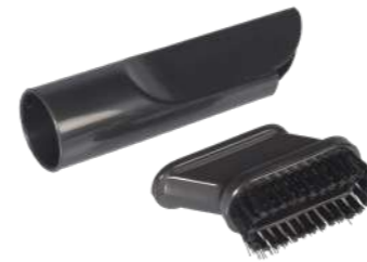
2in1 щелевая / обивочная насадка. Предмет номер. 115,127